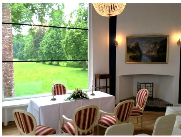
Gartensaal im Schloß (2 - 25 Gäste, keine Stehplätze)