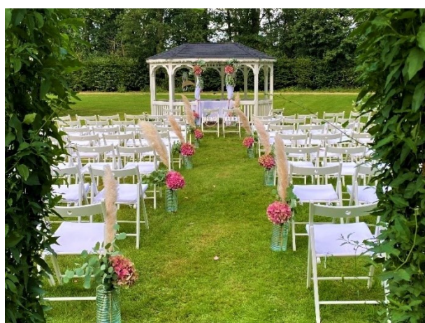
Hochzeitspavillon im Schloßpark (Personenzahl nach Belieben)