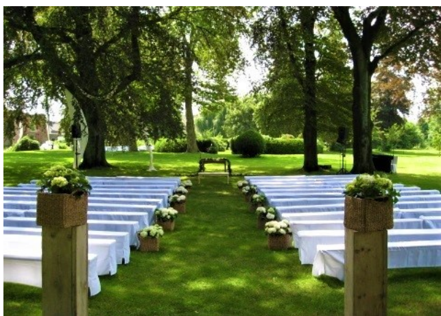
Hertefelder Schloßpark (Personenzahl nach Belieben)